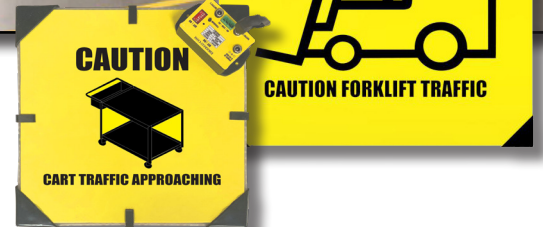
Znak LED (30 cm lub 60 cm)